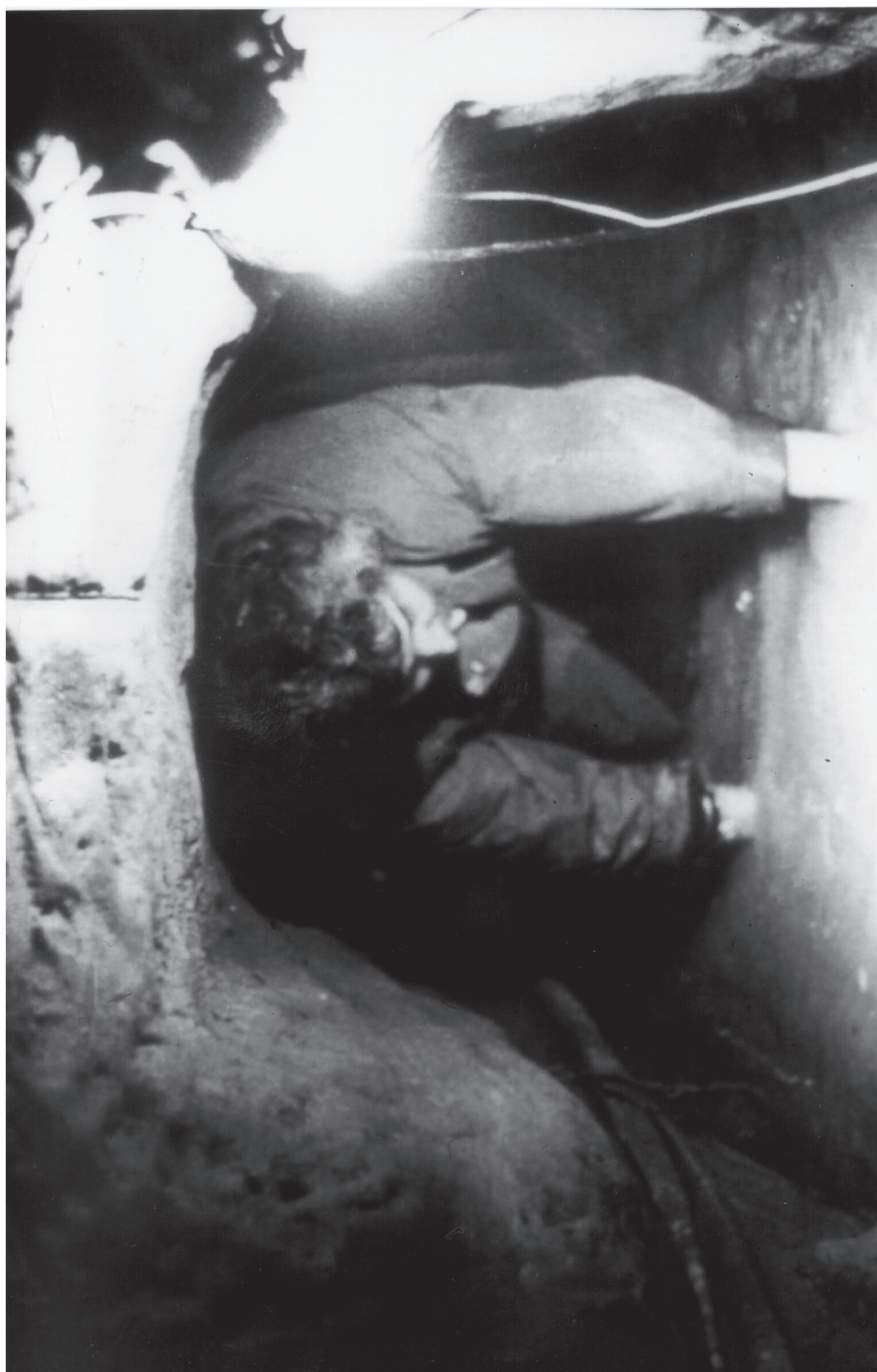
„Tunnel 57“ in der Bernauer Straße (Höhe Bernauer Ecke Strelitzer Straße), Oktober 1964