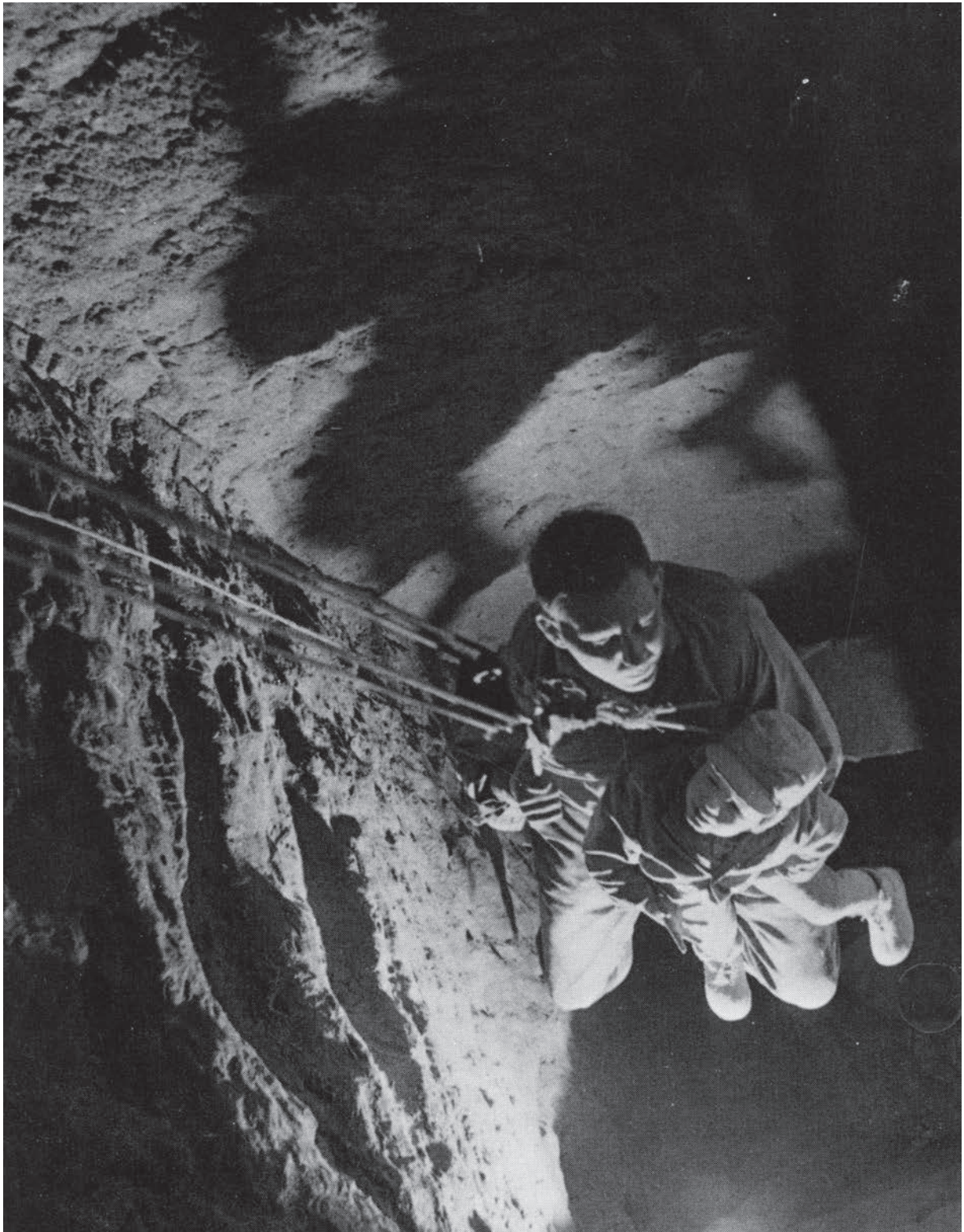
Postkarte: „Tunnel 57“ in der Bernauer Straße, 1964