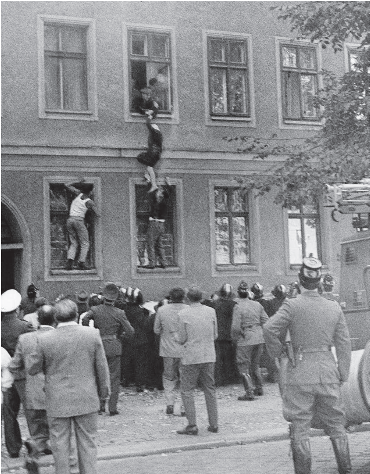
Flucht aus dem Grenzhaus Bernauer Straße 29, 25. September 1961