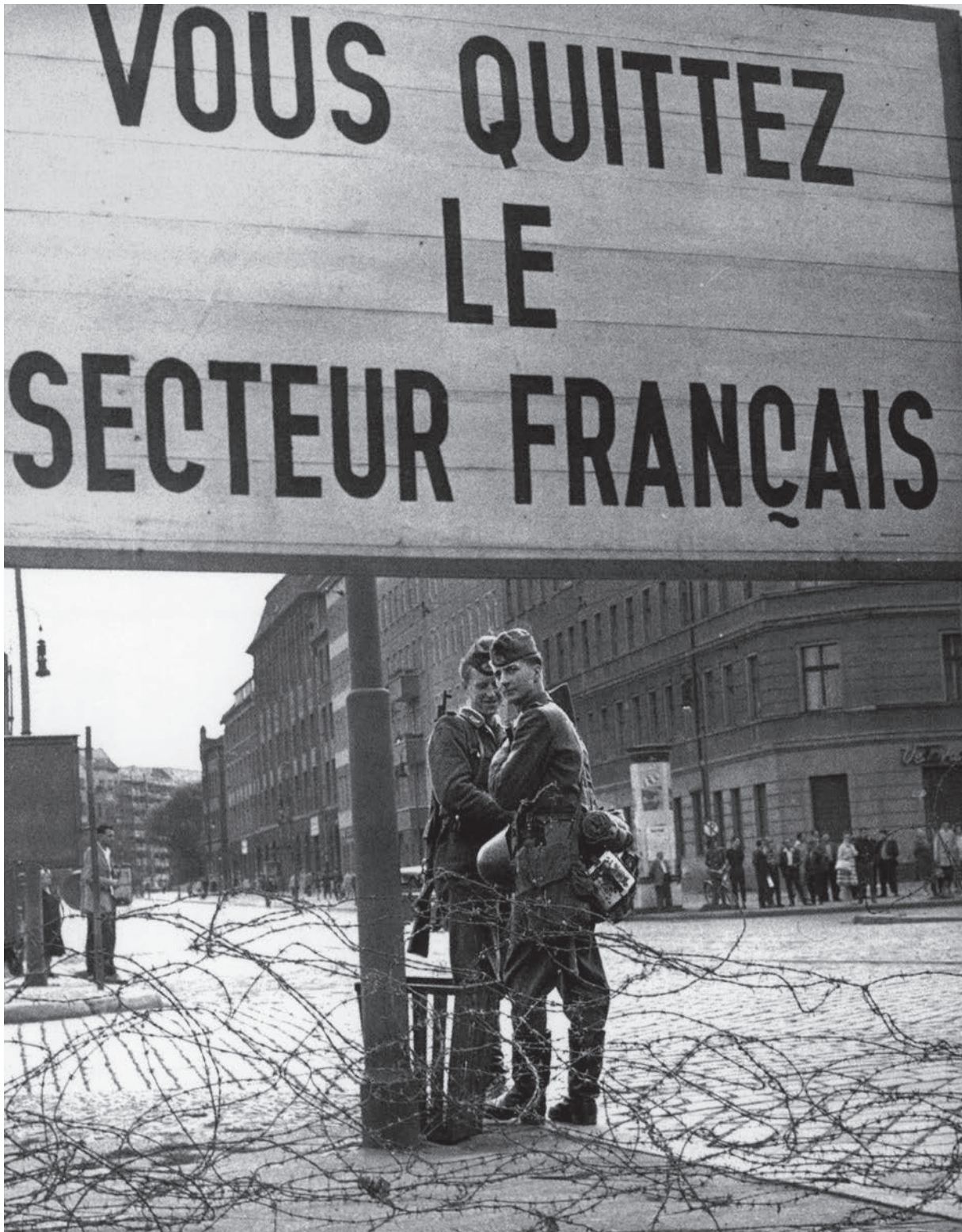
Postkarte: Grenzpolizisten bewachen den Stacheldrahtzaun an der Bernauer Straße Ecke Brunnenstraße, 13. August 1961