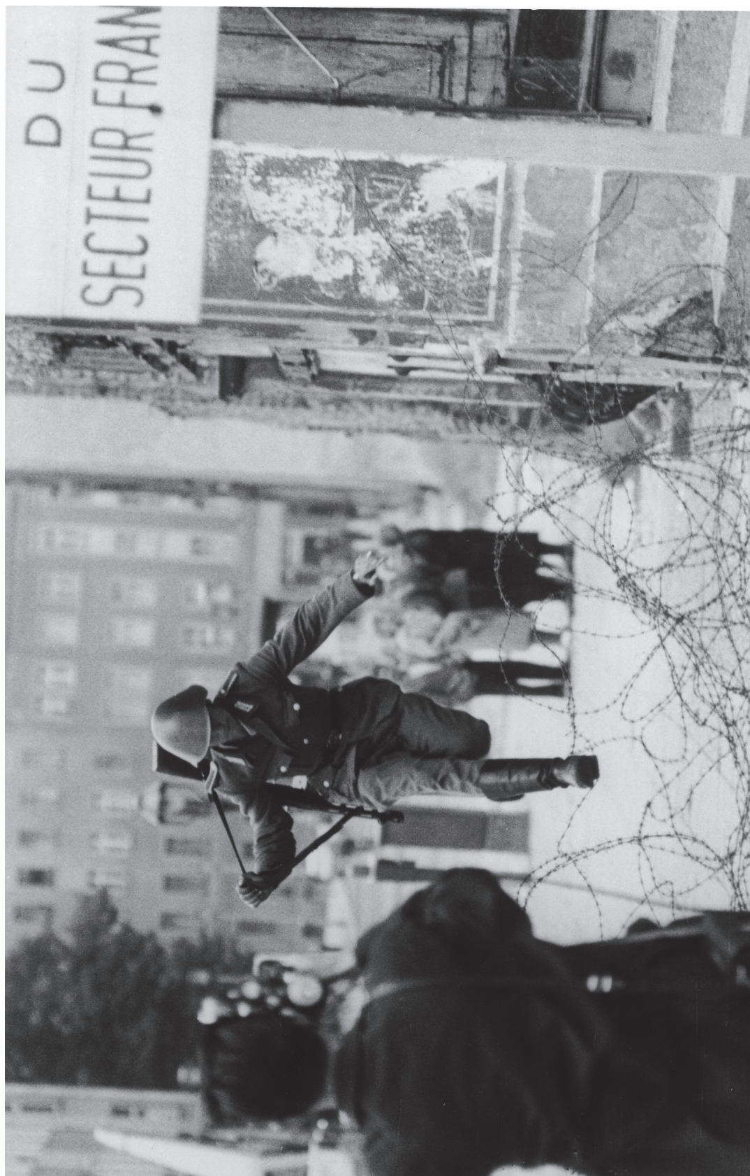
Fluchtsprung des Grenzpolizisten Conrad Schumann über den Stacheldraht an der Bernauer Straße Ecke Ruppiner Straße, 15. August 1961