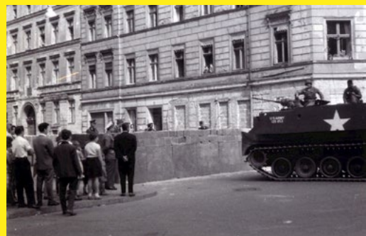
Grenzsoldaten, Passanten und US-Militärpolizisten im Panzer vor der Mauer am 15. August 1961.

Inmitten | Hindurch Private Fotografien vom Mauerbau Ab 13. August 2021 (13. und 15. August, 12–18 Uhr, 14. August, 10–18 Uhr), Gedenkstätte Berliner Mauer, Besucherzentrum